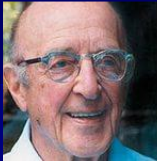
Карл Ренсом Роджерс ( 1902 - 1987)