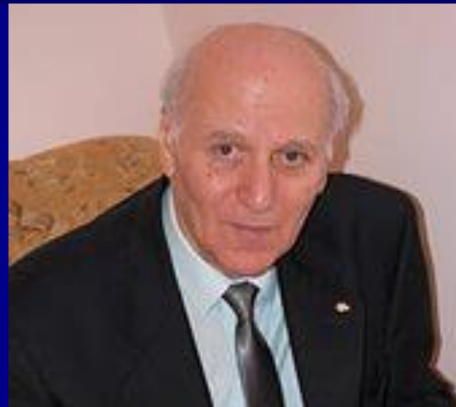
Шалва Александрович Амонашвили (Род. 1931)