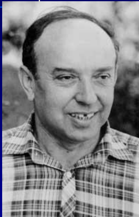
Олег Семёнович Газман (1936 – 1996)