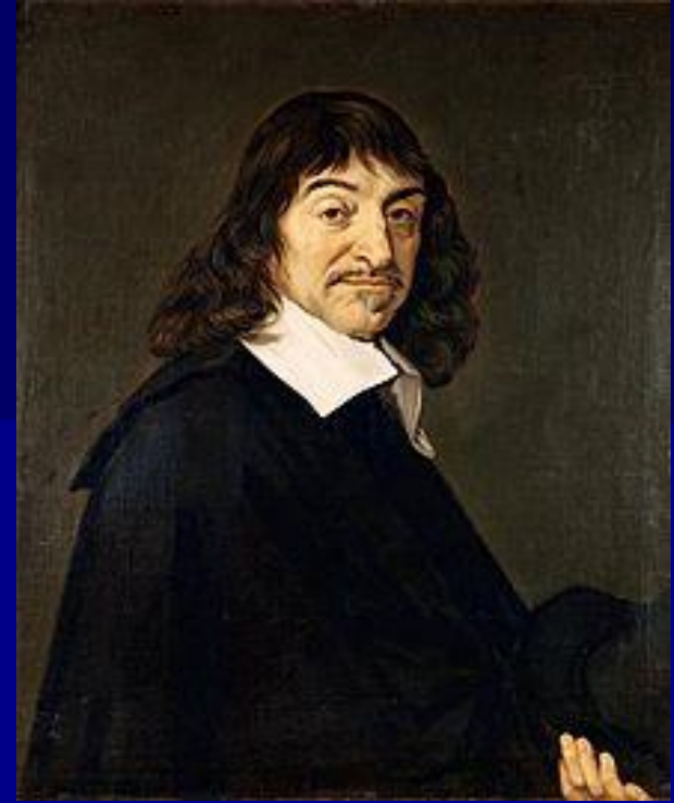
Рене Декарт (1596 – 1650)

« Мыслю, следовательно, существую » — философское утверждение, фундаментальный элемент западного рационализма Нового времени.