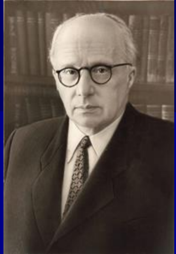
Рубинштейн Сергей Леонидович (1889 – 1960)